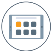
Ariba Guided Buying