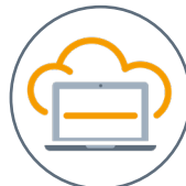
SAP Ariba Sourcing