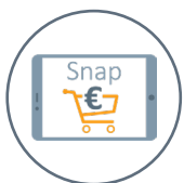
SAP Ariba Snap Buying