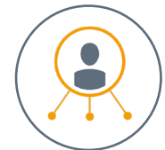
SAP Ariba Supplier Lifecycle and Performance