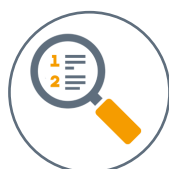
Order Confirmation Workflow