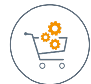
SAP Ariba Commerce Automation